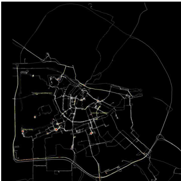
Fig. 4 – Mapa gerado pelo projeto Amsterdam RealTime. Fonte: [49].

O Projeto Amsterdam RealTime resultou no mapeamento da forma como os habitantes de Amsterdã se apropriaram dos espaços da cidade, o que incluiu as suas principais vias urbanas. Conjecturando-se a aplicação de um projeto semelhante no contexto das operações do EB, além das vias já existentes, novas possibilidades relacionadas a uma peculiar apropriação do espaço seriam “descobertas”, podendo servir como uma base cartográfica para o planejamento e execução de futuras operações da Força Terrestre. Trilhas nas matas, rotas nas montanhas, rotas fluviais e marítimas, caminhos desafiados, acessos, são exemplos de vias que existem nos mapas mentais de vários militares do EB.