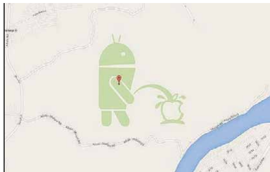
Fig. 3 – Exemplo de vandalismo ocorrido no Google Maps . Fonte: [7].

As práticas que têm sido observadas no EB, com relação à obtenção de geoinformações para o cumprimento de suas missões, não estão de acordo com o que é pregado pela END. É incoerente que, para cumprir suas tarefas, o EB dependa do suprimento de informações geográficas do território nacional fornecidas por outros países. O uso dessas informações fragiliza o emprego da Força Terrestre, criando uma vulnerabilidade ao vandalismo (Fig. 3) e a ações de forças adversas, como a desinformação e a sabotagem. Além disso, caso haja um cerceamento do acesso a esses produtos e serviços, muitas operações que o EB realiza atualmente serão dificultadas.